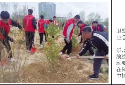
(撰稿:李欣强)

本报讯 春日大地,万物复苏,又是一年植树时。4月24日,后勤保障部组织开展了植树活动,以实际行动践行绿色发展理念,为美好绿色校园建设增添绿彩。此次植树活动邀请了学校领导、校区各二级学院、国际教育学院留学生代表 300 余名,师生代表 200 余人,共栽植各类苗木 500 余棵。文莱留学生在踊跃参加校园义务植树活动,辛苦劳动的同时收获团队