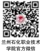
兰州石化职业技术学院官方微信